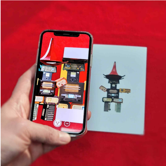
백남준, <슈베르트>, 2002