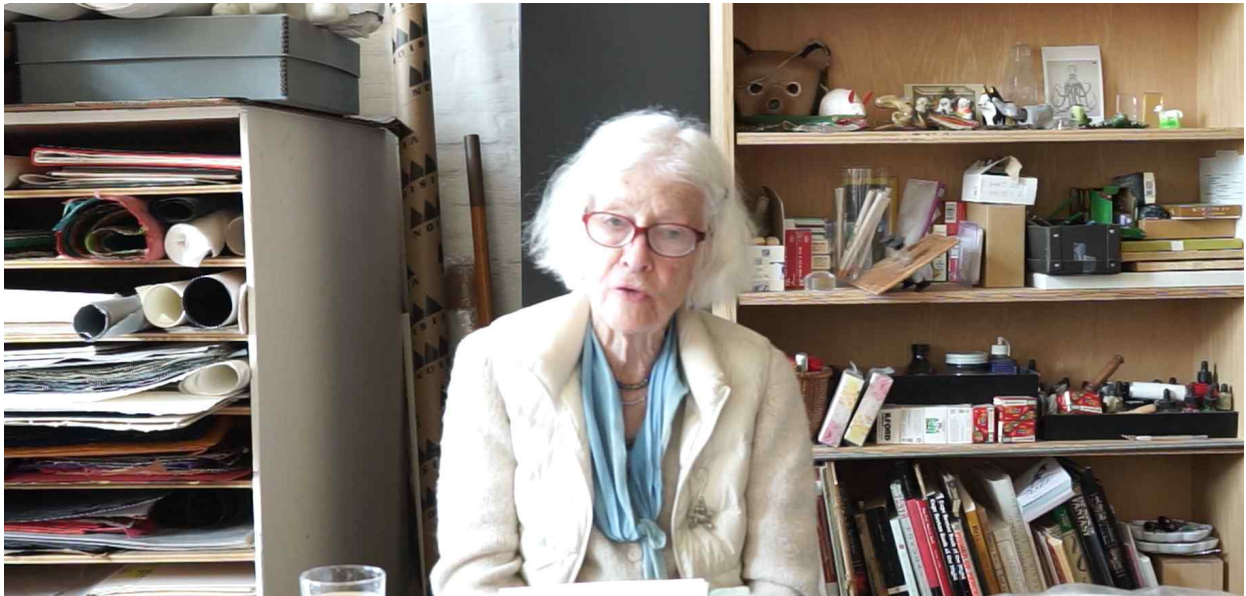
사진: 수상자 조안 조나스의 예술상 수상 기념 강연